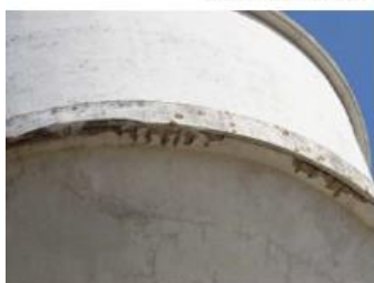
Armatures apparentes corrodées – ceinture intermédiaire